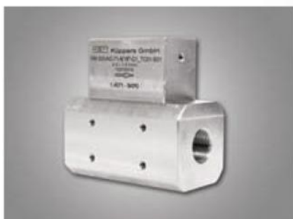
Для высоких давлений

Для высоких давлений: Эти расходомеры находят применения в оффшорных приложениях. Устойчивость к высокому давлению позволяет использовать их в водоструйных режущих системах.