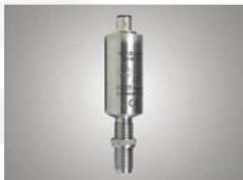
WT.02 / WI.02

Локальные преобразователи WT.02 / WI.02 это пассивные 4-20 мА датчики с входным каскадом несущей частоты (WT.02) и с индуктивным входным каскадом (WI.02) соответственно.