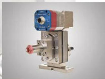
Dispense Control Device