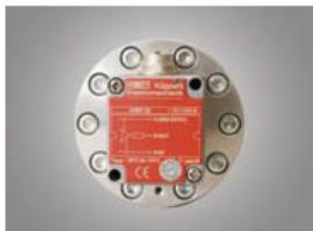
Датчик Холла для шестеренчатых расходомеров в алюминиевом исполнении