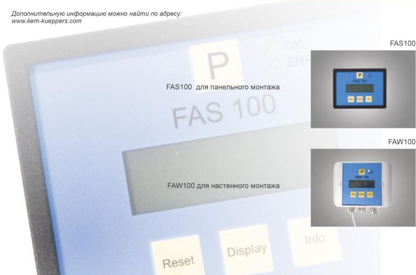
FAS100 для панельного монтажа