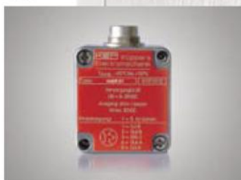
Датчик Холла с двойным регистратором для умножения импульса и обнаружения обратного потока.