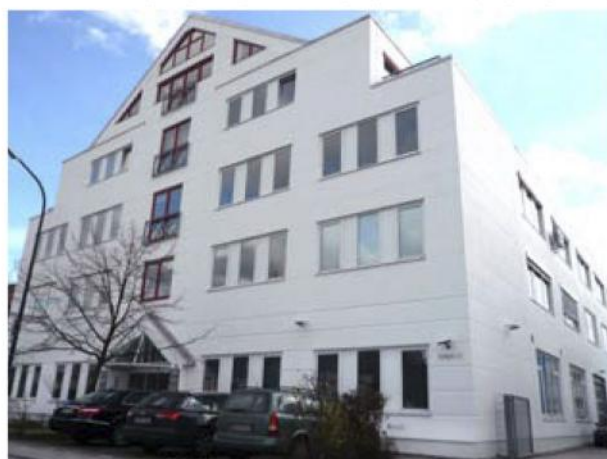
Центр торговли и разработки (Карлсфельд)